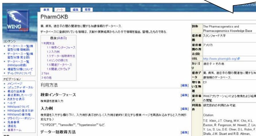
図1 WINGpro (http://wingpro.lifesciencedb.jp/)