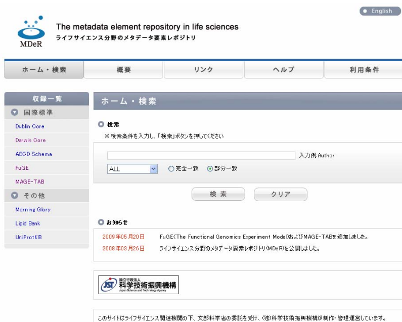
図 4 ライフサイエンス分野のメタデータ要素レポジトリ ( http://mder.jst.go.jp/ )